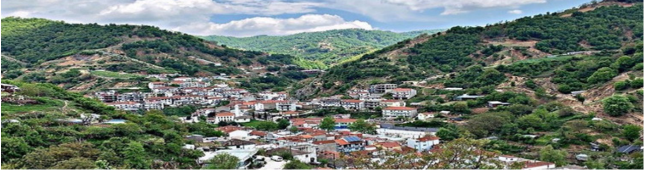
Mustafçova Köyü Panoramik Fotoğrafı

Mustafçova köyü İskeçe şehrinin 18 km kuzeyinde yer alan bir dağ köyüdür. İskeçe'nin en büyük köylerinden biri olan Mustafçova'nın nüfusu 3000 civarındadır.