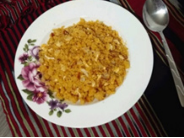
Smidar / Koşmar

çoğu, ölünün ruhunu huzura erdirmeye yöneliktir. Ölenin ardından ölen için bir şeyler yapma ihtiyacı duyulmaktadır. Bu pratiklerin başında ölünün hayrına verilen yemekler gelmektedir. Yemeklerin vazgeçilmezi ise yine hiç kuşkusuz ekmektir.