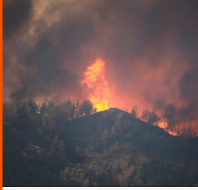
AĞUSTOS AYINDA BATI TRAKYA'DA MEYDANA GELEN YANGINLARDAN GÖRÜNTÜLER