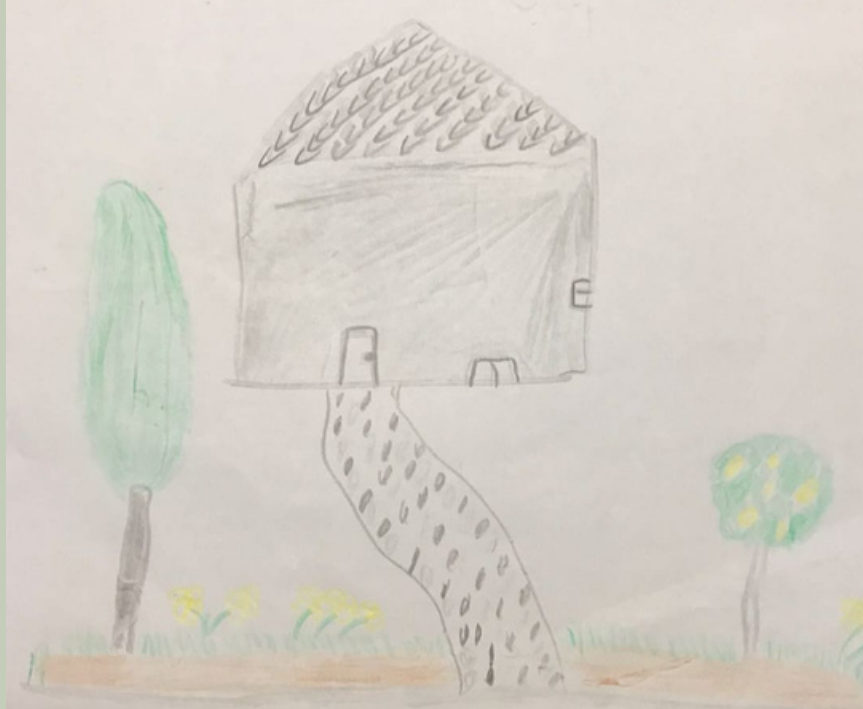
Sümeyye HOCAOĞLU İlkokul 4. sınıf öğrencisi

Sizin de yayınlamamızı istediğiniz şiirleriniz, yazılarınız, resimleriniz ve çektiğiniz fotoğraflar varsa, bize info@btaytd.com e-posta adresinden gönderebilirsiniz.