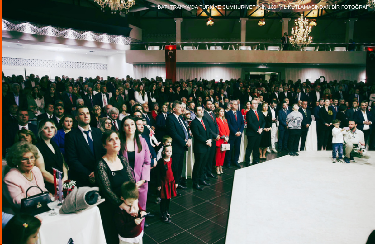
BATI TRAKYA'DA TÜRKİYE CUMHURİYETİ'NİN 100. YIL KUTLAMASINDAN BİR FOTOĞRAF

BATI TRAKYA'DA TÜRKİYE CUMHURİYETİ'NİN 100. YILI COŞKUYLA KUTLANDI