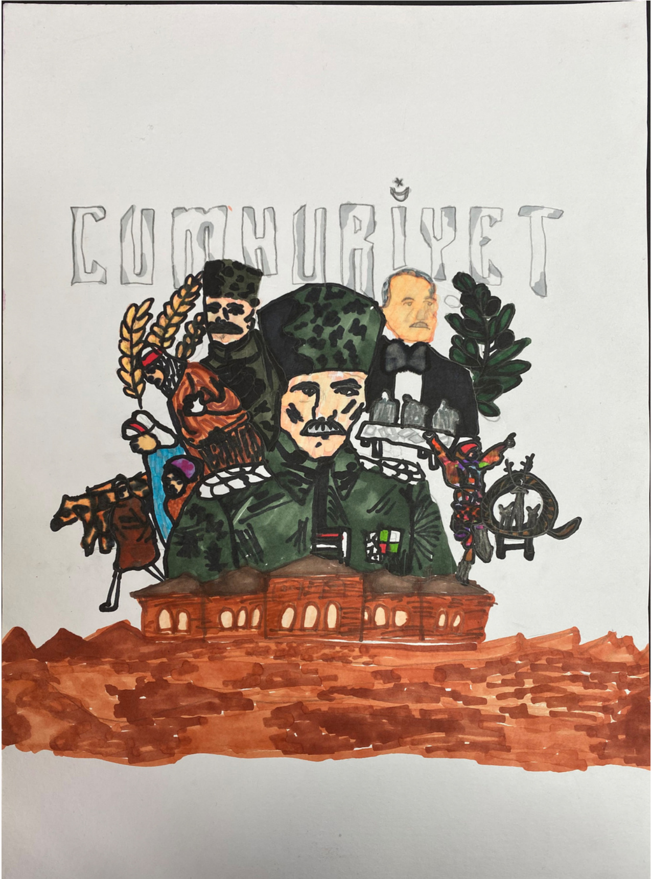
3. OLAN RESİM