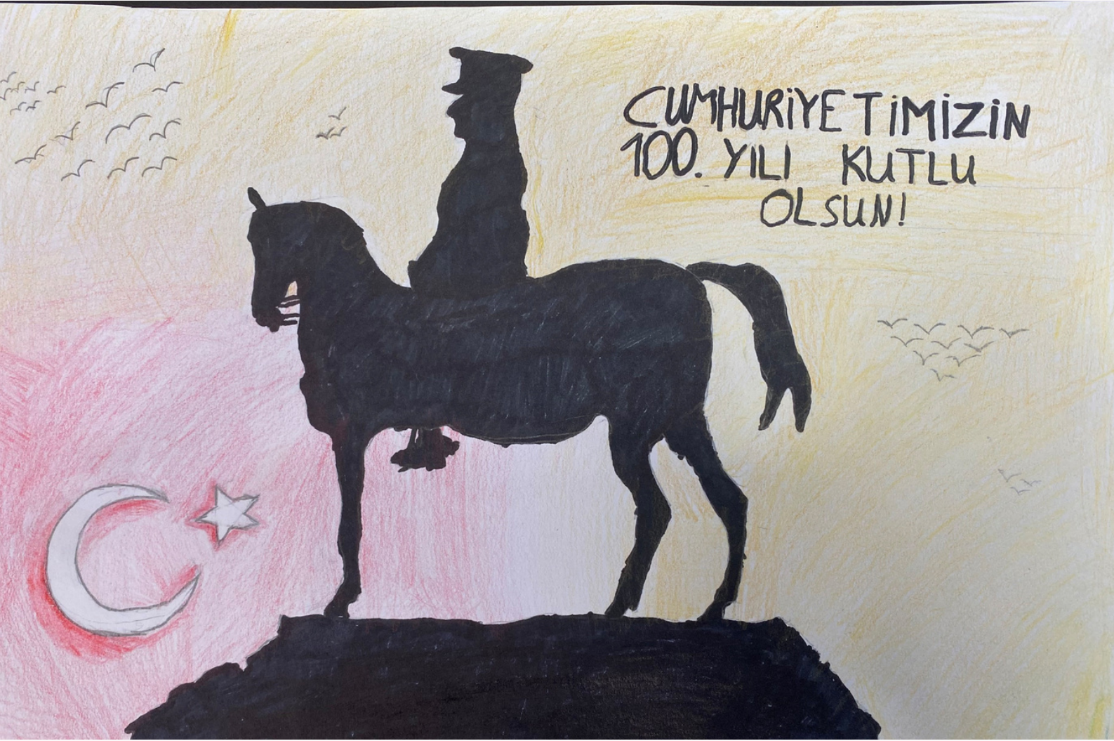
2. OLAN RESİM