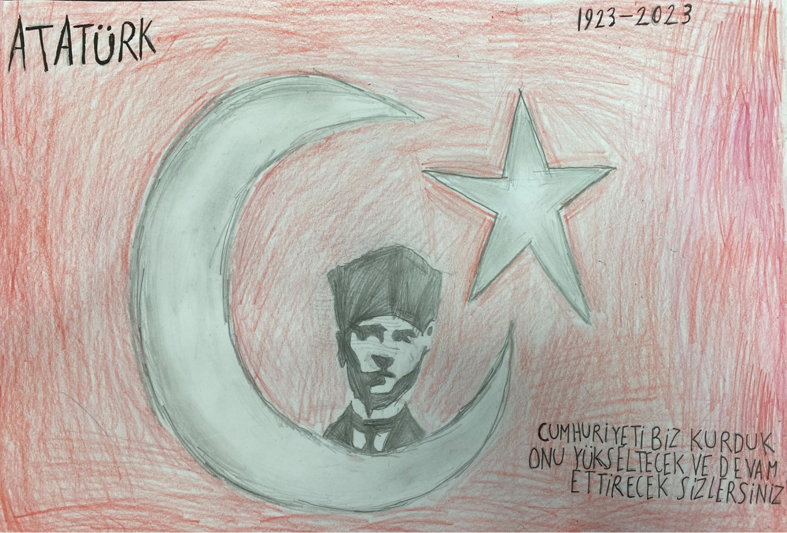
1. OLAN RESİM

İskeçe Türk Birliđi tarafından düzenlenen "Anavatan Türkiye Cumhuriyeti'nin 100. Yılı" temalı resim ve kompozisyon yarışmalarında dereceye girmiş olan resim ve kompozisyonlar