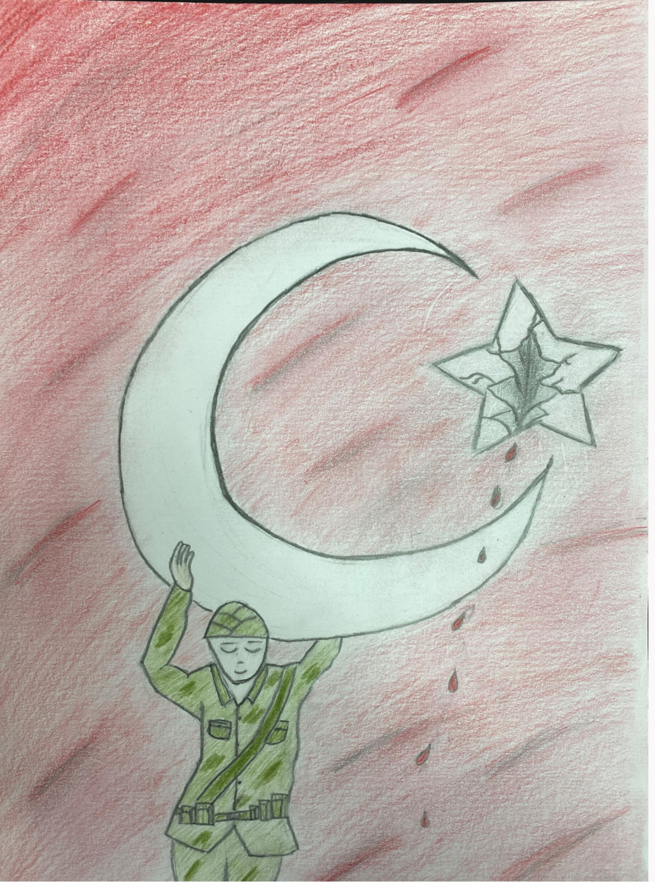
4. OLAN RESİM