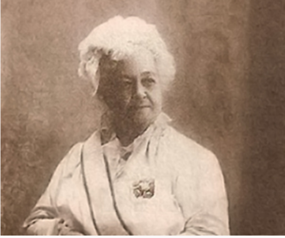
Leyla Saz (1850 – 1936)

Kıl meclisi âmâde ne derlerse desinler İç dilber ile bâde ne derlerse desinler. lemde nedir farkı bana medh ile zemmin Sağ olsun ahıbbâ da ne derlerse desinler.