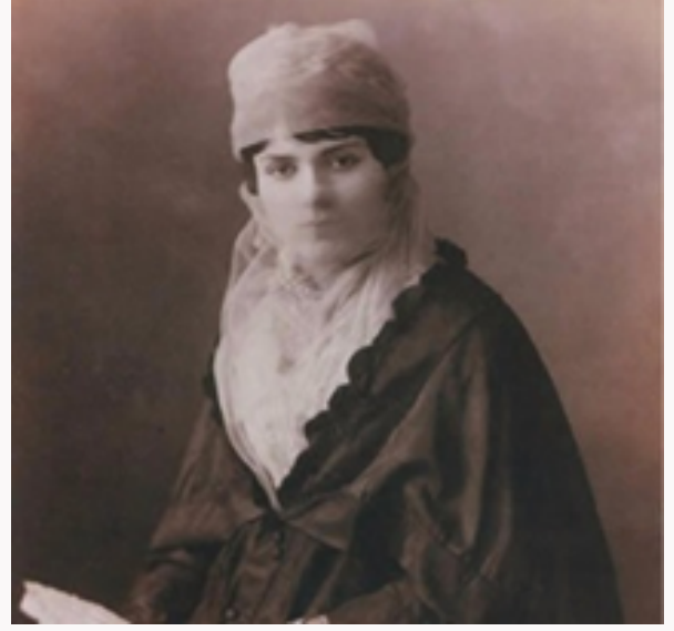
Mihri Hatun (1416-1506)

Divan edebiyatında pek görülmediği halde, güncel konulara değinen şiirler yazdı. Şiirleriyle duygulu aşklarını, o günün koşullarının elverdiği ölçüde açık bir biçimde ifade etti. Hatta kimi şiirlerinde aşık olduğu kişinin adını açıkça yazdı. Döneminin tabularını zorlayan ve düşündüklerini cesurca söylemeyi başaran Mihrî Hatun, bu nedenle Antik Yunan kadın filozofu ve şairi Sappho ile kıyaslanmıştır.