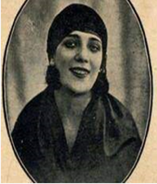
Makbule Leman (1865 – 1898)