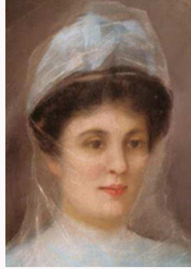
Şair Nigar Hanım (1856 - 1918)

Savaş yıllarının salgın hastalığı tifüse yakalandı. Kaldırıldığı Şişli Etfal Hastahanesi'nde 1 Nisan 1918'de vefat etti.